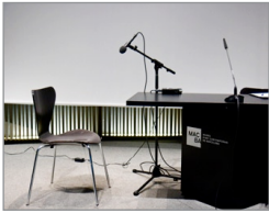
01 El estudio radiofónico de Ràdio Web MACBA en el Auditorio del MACBA. Foto: Gemma Planell/MACBA, 2012

Sònia López es la responsable de la web y las publicaciones digitales del MACBA desde el 2001. Ha participado en diversos proyectos artísticos y pedagógicos en el MACBA y otras instituciones culturales de Barcelona. Activista crafter a tiempo parcial.